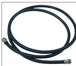
Flexible de distribution