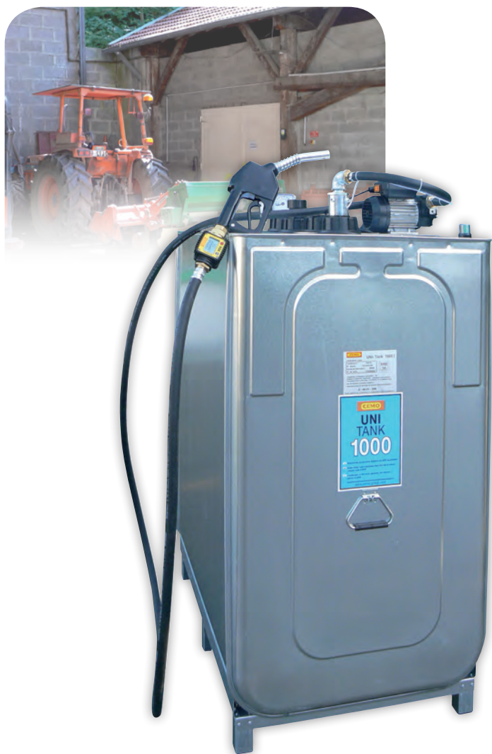
Station UNI PRO 1000 litres avec compteur digital en option